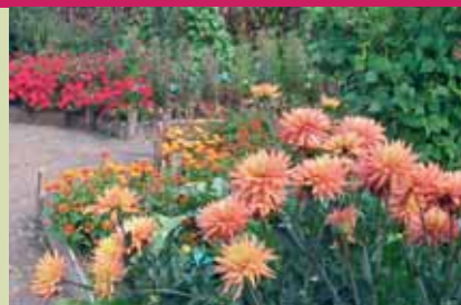
Flours, légumes, insectes... et idées à profusion !

Les aménagements astucieux susciteront certainement votre curiosité.